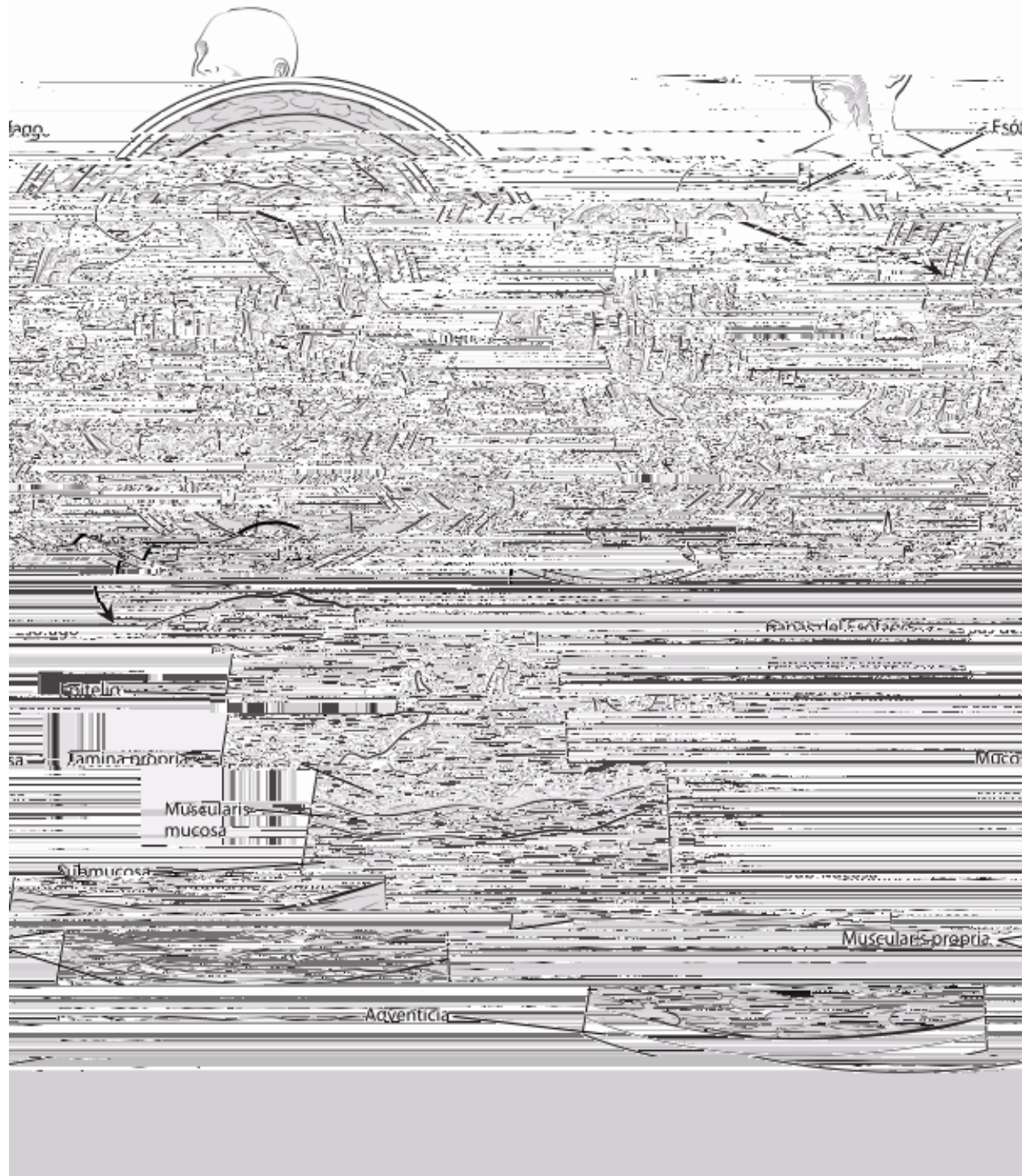
La pared del esófago